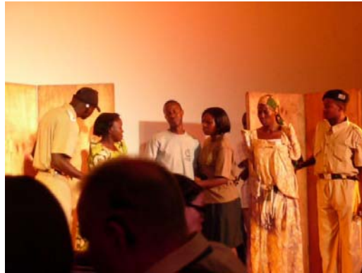
Pillanatkép a „Csend Színház” (Silent Theatre) előadásából

A harmadik nap délelőttjén a konferencia zárásaként a felszólalók az előző nap előadásainak tapasztalatait foglalták össze. Mindegyikük hasznosnak és tanulságosnak találta az elhangzottakat, különösen a fejlődő országokból érkezett résztvevők számára nyújtott nagyon sok új ismeretet, ötletet. Délután látogatást tehettünk a helyi, Ntinda siketek iskolájában. Az út egy óra volt a szállástól.