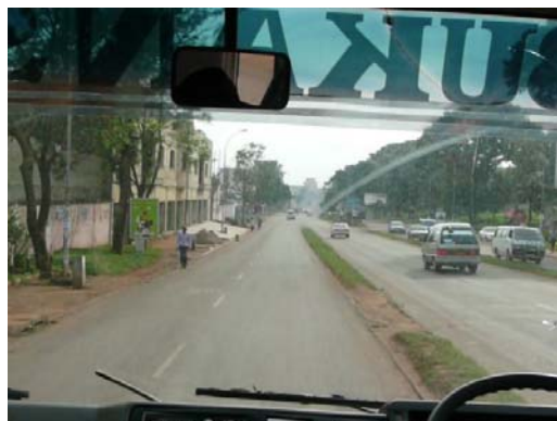
Úton a Siketek Iskolája felé

A harmadik nap délelőttjén a konferencia zárásaként a felszólalók az előző nap előadásainak tapasztalatait foglalták össze. Mindegyikük hasznosnak és tanulságosnak találta az elhangzottakat, különösen a fejlődő országokból érkezett résztvevők számára nyújtott nagyon sok új ismeretet, ötletet. Délután látogatást tehettünk a helyi, Ntinda siketek iskolájában. Az út egy óra volt a szállástól.