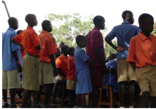
Diákok az iskola udvarán

Házilag készített aprósüteményekkel, mogyoróval és üdítővel kínálták bennünket a gyerekek, akik láthatóan élvezték jelenlétünket.