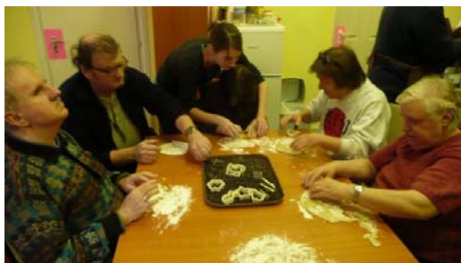
Készülőben a mézeskalács

2009. november 26-án, csütörtökön mézeskalácssütést tartottunk, melyen tagjaink közül többen részt vettek. Egy rövid bemutatkozást követően mindenki kézbe vehette a mézeskalács formákat, majd a begyúrt tésztából elkezdhették kiszaggatni a formákat.