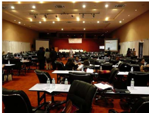
A konferencia helyszíne

de Afrikában általánosságban is, a siketvakság kialakulásának egyik legfőbb oka a rubeola fertőzés, ezért egyesületünk elsődleges célja, a rubeola fertőzés visszaszorításáért való küzdelem Ugandában és egész Afrikában. Az ugandai himnusz és tiszteletadás kíséretében érkezett meg az ugandai köztársasági elnök, H.E. Yoweri Kaguta Museveni. Egyébként a konferenciával egyidőben és helyen tartotta az Afrikai Unió az elnöki csúcstalálkozóját, így az egész területen sok fegyveres katona vigyázott a magas szintű delegációk biztonságára, ezzel együtt pedig a mi biztonságunkra is. A köztársasági elnök beszédében kiemelte, hogy az ugandai parlament is ratifikálta a Fogyatékkal Élő Személyek Jogairól szóló ENSZ Egyezményt, és maga is arra törekszik, hogy az Egyezmény szellemében biztosítsa az Ugandában élő fogyatékos személyek, beleértve a siketvakok jogait is.