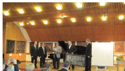
Az ajándék bőr-kép átadásának pillanata

ünnepélyes átadására: a bőr képet, amely az MVGYOSZ logóját ábrázolja köszönetnyilvánításképpen vehette át a Szövetség elnöke. A cseh művészek ezzel fejezték ki tiszteletüket, örömeiket és hálájukat, ugyanis hazájukon kívül másutt még nem rendeztek kiállítást ezekből az alkotásokból, először a Magyar Vakok és Gyengénlátók Országos Szövetségébe hozták el különleges képeiket.