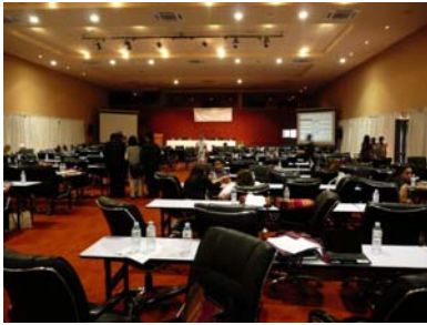
A konferencia helyszíne