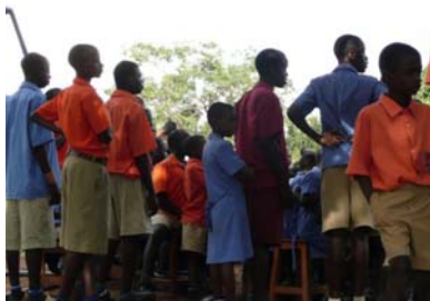
Diákok az iskola udvarán

Sajnos az iskola területén és épületein látszott az elmaradottság, mégis, valahogy maga a hely kellemesnek, természetközelinek hatott. A látogatás igazi hangulatát a tündéri gyerekek érdeklődő és barátságos kíváncsisága adta meg. A külföldi résztvevők örömmel vették karjukba a kisebbeket. Ezalatt egy kisfiú folyamatosan dobolt a közelben.