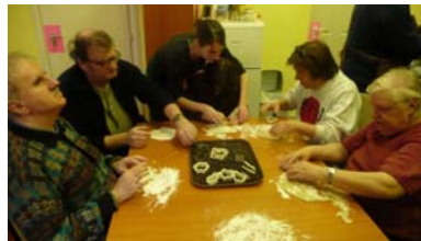
Készülőben a mézeskalács

2009. november 26-án, csütörtökön mézeskalácssütést tartottunk, melyen tagjaink közül többen részt vettek. Egy rövid bemutatkozást követően mindenki kézbe vehette a mézeskalács formákat, majd a begyúrt tésztaból elkezdhették kiszagatni a formákat.