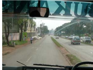
Úton a Siketek Iskolája felé

Délután látogatást tehattünk a helyi, Ntinda siketek iskolájában. Az út egy órás volt a szállástól.