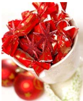
A közkedvelt, karácsonyi édesség

A budapesti Vendéglátóipari Múzeumban található régi szaloncukor-csomagoló sztanolpapírokat harmincféle színben, és megtekinthető egy "ricselő gép" is. Ez a szerkezet tulajdonképpen egy rojtozó gép, amellyel a szaloncukor papírját gyorsan be lehetett rojtozni. Amikor a cukor megdermedt és megszáradt, becsomagolták. A papírra angyalkákat ragasztottak, és már lehetett is a karácsonyfára akasztani. Persze nem mindenki engedhette meg magának, hogy csillogó cukrászdában vásároljon szaloncukrot a fára, ezért sokan otthon készítették el a csemegét, melynek receptje talán még mindig ott lapul valahol nagymamánk fiókjának legmélyén.