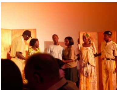
Pillanatkép a „Csend Színház” (Silent Theatre) előadásából

A nap végén egy jelnyelven előadott – és angol nyelven tolmácsolt – színpadi játékot tekintettünk meg az ugandai siketekből és siketvakokból álló Csend Színház szereplésével. A történet egy nehéz helyzetbe került családról szól, ahol férje elvesztése után a két siket lánnyal és egy siketvak fiúval magára maradt özvegyasszony próbál kiutat és megoldást találni arra, hogyan tudná gyermekeit iskolába járatni. Nem talál jobb megoldást, mint, hogy siketvak fiát a szomszédasszonynak eladja szolgálónak, ám ezt a törvény bünteti, így megjelenik a rendőrség, de végül elengedik az asszonyt. Sajnos, ahogy a zárómondatban a siketvak fiú fogalmazott: „Ez a szomorú valóság Ugandában”.