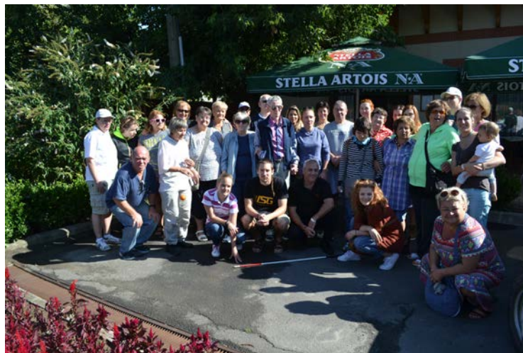
Csoportkép a tábor résztvevőiről

- Jelenleg még helykeresési fázisban tart a dolog. Nagyon szeretnénk, hogy ősszel meglegyen a jövő évi tábor helyszíne, amiről majd adunk részletes információt.