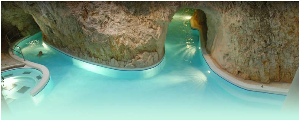
A barlangfürdő belülről

A külső medencékben (a Kagyló alatt) a meleg termásvíz oltalmából élvezhetjük a havon szikrázó téli napsütést (hátsó címlap, lent), nyáron a szabadban állnak a napozóágyak, s a déli hőség előtt kínálnak felüdülést (hátsó címlap, fent) a barlangjáratok. A fürdőzés kiegészíthető szaunázással, illetve egyéni gyógykezeléssel is. A páratlan mikroklíma, a tiszta, kék víz, a látvány és az egyedi terápiák után egyre többen távoznak felfrissülten és gyógyultan a Barlangfürdőből, hogy másoknak is elmondhassák: ez egy csoda.