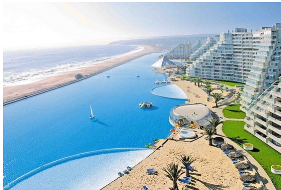
A világ legnagyobb medencéje

Méretét nagyjából úgy lehet elképzelni, mintha 6000 8 méteres medencét tennénk egymás mellé. Éppen ezért nem csak úszkálni lehet benne, hanem szörfözni, vízibiciklizni, kajakozni, mindezt 50 méterre magától az óceántól.